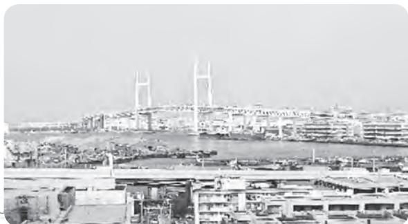
港の見える丘公園からベイブリッジをのぞむ