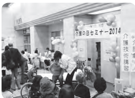
介護の日セミナー2014での介護劇