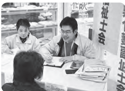
介護相談 (イトーヨーカドー上永谷店)